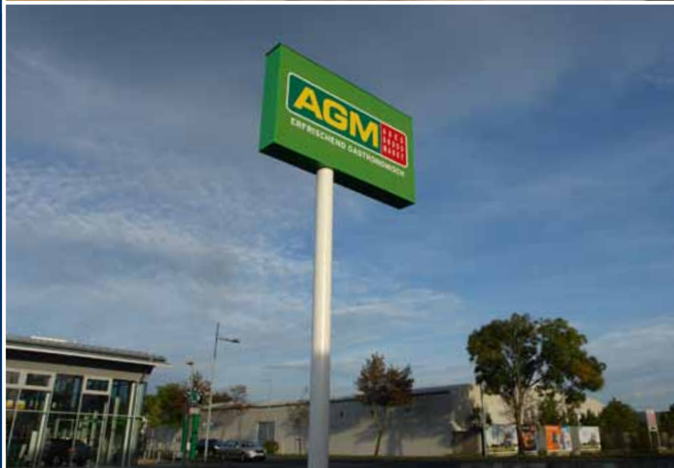
Spannfolienpylon; gerade Ausführung / Spannfolienleuchtkasten auf Werbeturm