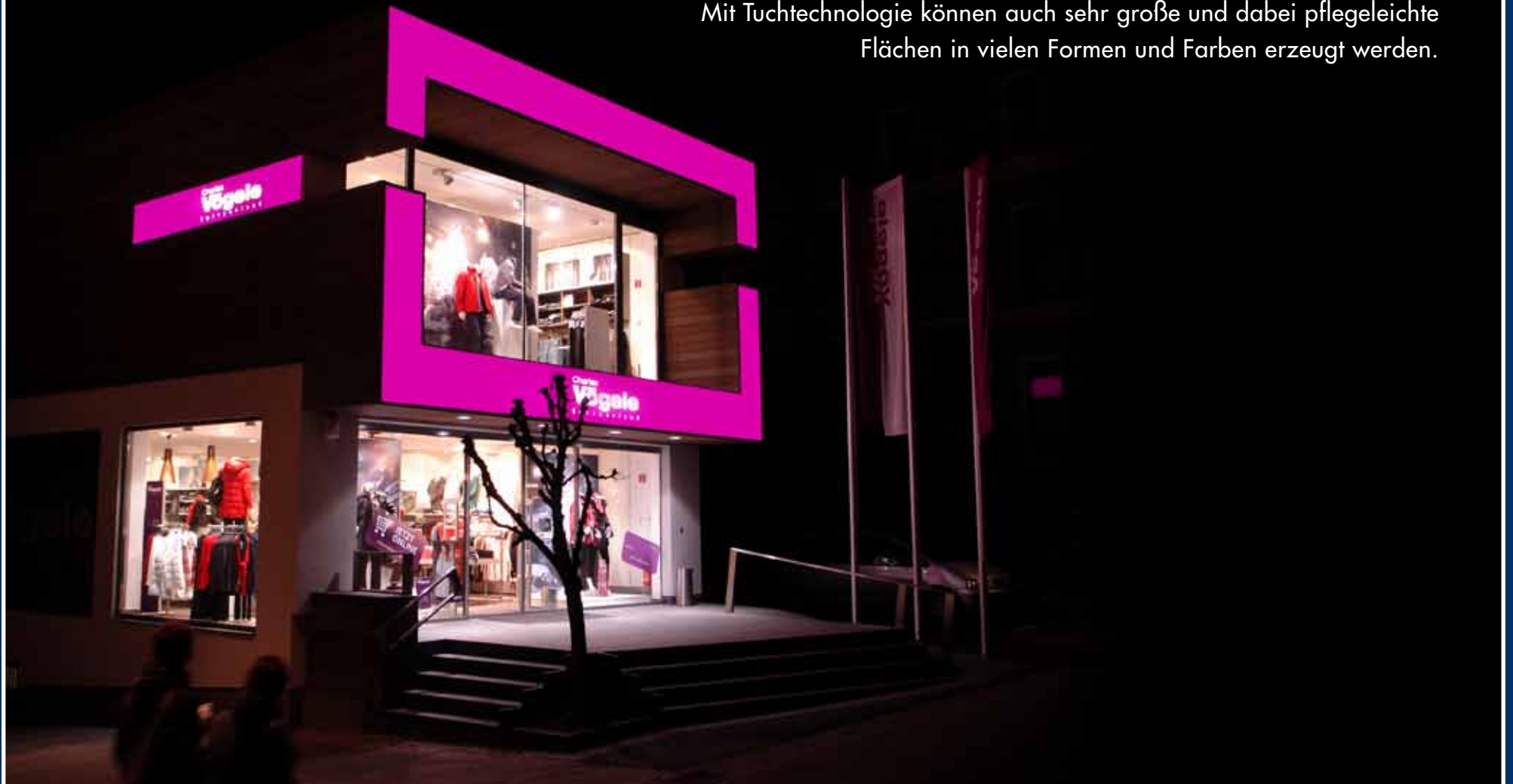
Spannfolienleuchtkästen; auffällige Sonderausführung

Mit Tuchtechnologie können auch sehr große und dabei pflegeleichte Flächen in vielen Formen und Farben erzeugt werden.