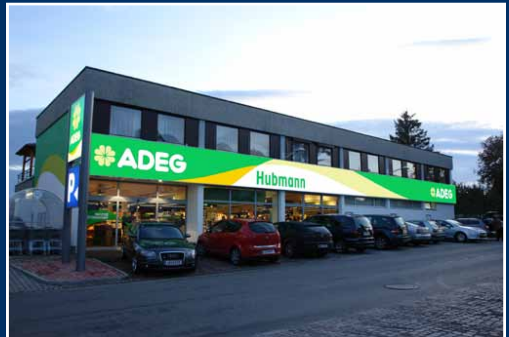
Spannfolienleuchtkästen; halbrunde / gerade Ausführungen

Spanntücher können mit allen gängigen Verfahren bedruckt oder folienbeschriftet werden.