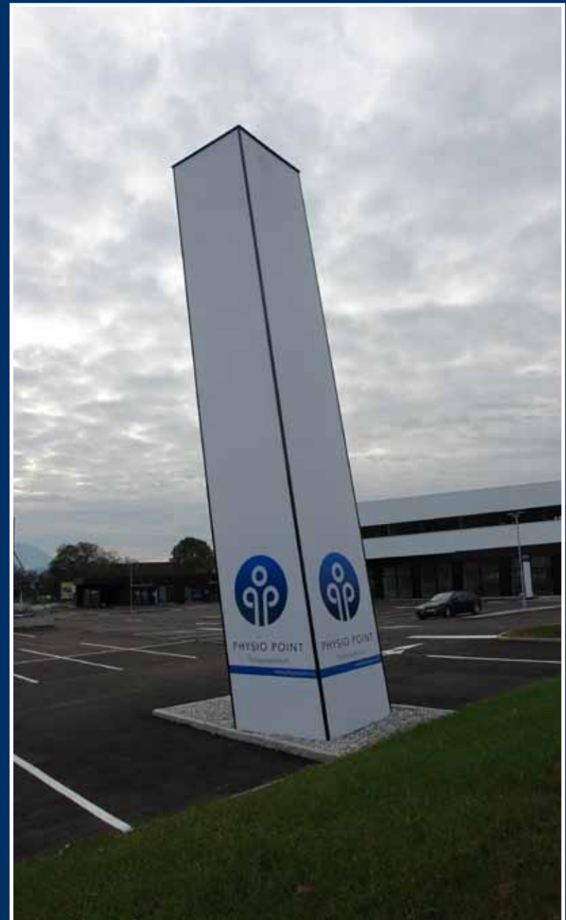
Spannfolienpylon; schräge Sonderausführung